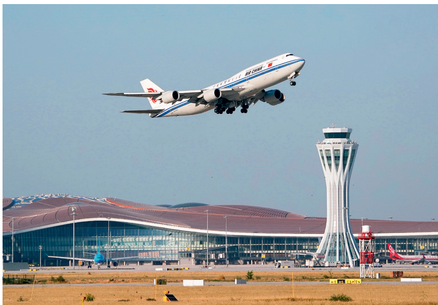
9月25日,中国国际航空公司的CA9597次航班从北京大兴国际机场起飞。

在新中国成立以来的70年中,中国社会生产力的提高、综合国力的增强和人民生活水平的改善,都显现出历史性跨越的特点,创造了人类发展历史上罕见的奇迹。从社会生产力和综合国力来看,新中国成立以来,实现了一系列从独立自主的“第一次”到进入世界科技前沿行列的飞跃。例如,从天安门广场建筑群、国家体育场(鸟巢)到北京大兴国际机场,从南京长江大桥、北京