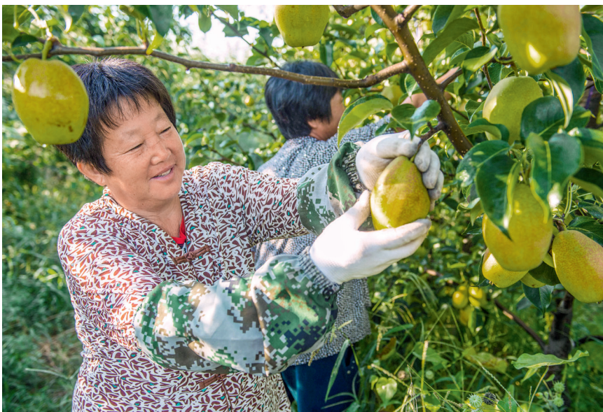
8月31日，河北省枣强县马屯镇东张邢村果农在采摘密植梨。近年来，枣强县在脱贫攻坚过程中，引导当地农民因地制宜发展特色密植梨种植。

区及沿海、沿边、沿江、沿线和内陆中心城市对外开放，到加入世界贸易组织；从扩大对外商品贸易到引进外商投资；从“引进来”到“走出去”；从以资源比较优势参与全球分工体系，到国内国际联动开放发展；从共建“一带一路”、设立自由贸易试验区，到谋划中国特色自由贸易港；从多边贸易体制的积极参与者、坚定维护者，到经济全球化的积极推动力量和国际经贸规则改革责任的参与方。